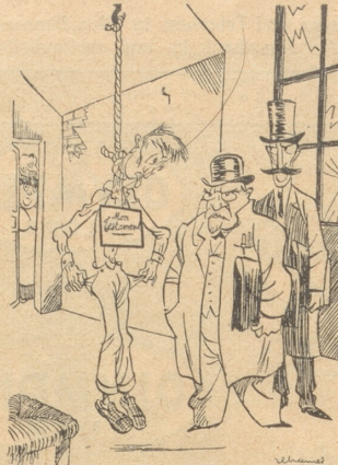
Verzweifelter Steuerzahler erhängt sich, weil er dem Staate 6000 Krös. Steuern nicht zahlen kann. . . . Wir hätten ihm nicht so viel lassen sollen, daß er sich noch einen Strick kaufen konnte.“ (Le Rire)