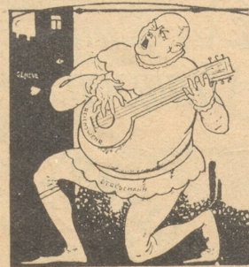
Pazifistische Serenade. Troubadour Grefemann: „Dieses verstümmte Instrument (Reichswehr) verdirbt mir alle Effette.“ (Rotenkrater, Amsterdam)

Mutter zum Söhnchen: „Wer hat die ganze Chokolade aufgeessen, die man mir zu Weihnachten schenkte?“ „Ich weiß es nicht, Mutter.“ „Warst Du es?“ „Nein, aber vielleicht das kleine Jesus- kind, das alle Jahre wieder kommt!“ * „Unser Freund T. ist ganz konsterniert. Seine Frau ist mit einem Knaben nie-