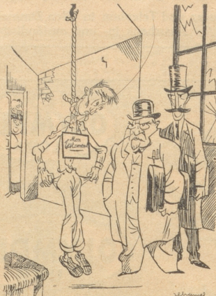
Verzweifelter Steuerzahler erhängt sich, weil er dem Staate 6000 Krös. Steuern nicht zahlen kann. . . . Wir hätten ihm nicht so viel lassen sollen, daß er sich noch einen Strick kaufen konnte.“ (Le Rire)