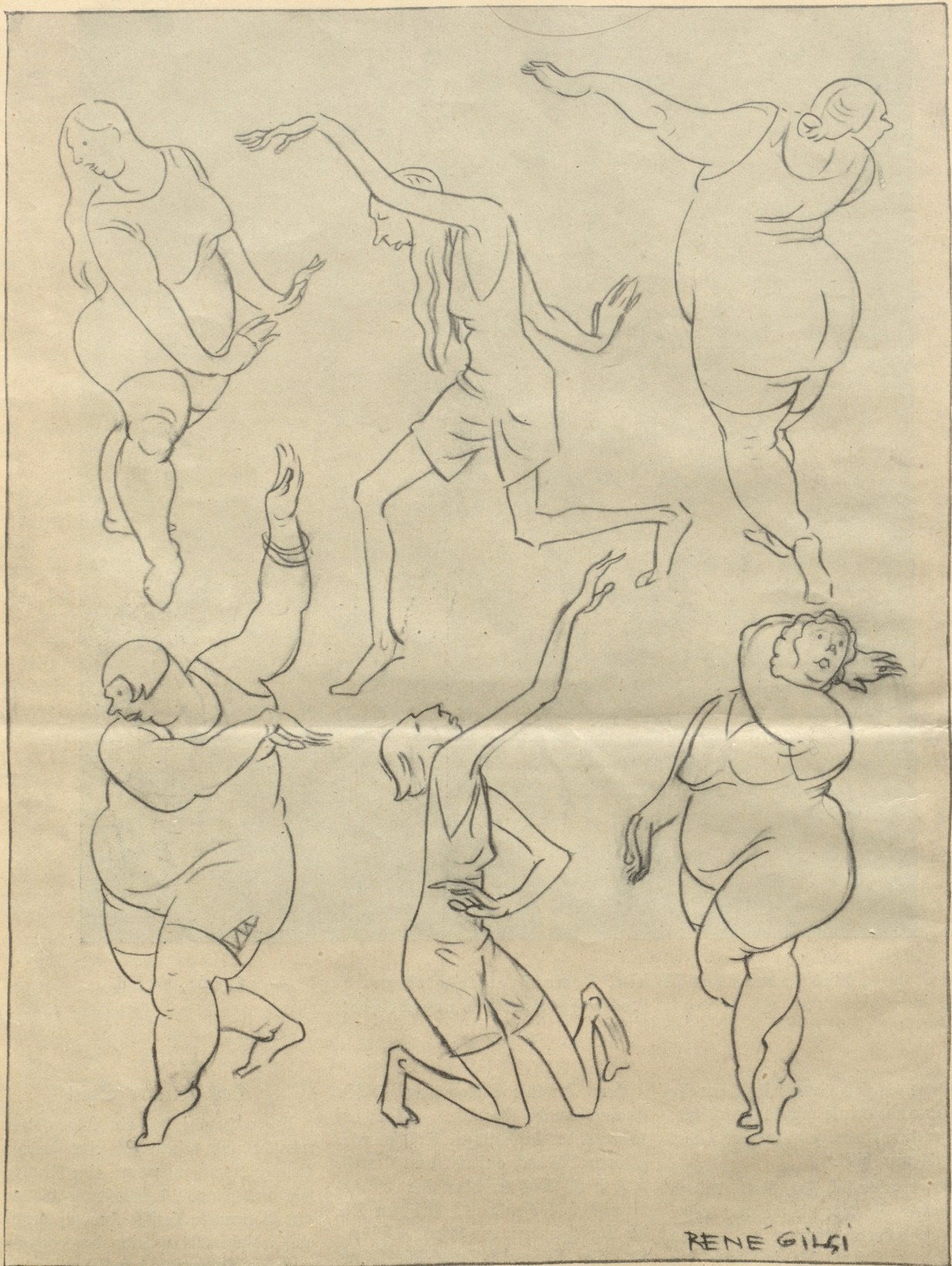
Zwei Zentner Speck und Eurythmie — Vereint sich öfterß, aber wie!

zähle ich ihm einiges Heroisch-Altgriechische. Nach einer Weile weiterer Berücksichtigung meint er sehr sachlich, in Er-