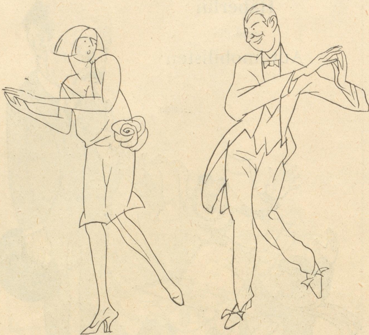
Der „Truda-Trott“ zu Ehren der Kanalschwimmerin Gertrud Ederle. Bei diesem Tanz werden die Bewegungen des Schwimmens nachgeahmt.