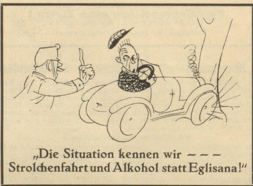
„Die Situation kennen wir --- Strolchenfahrt und Alkohol statt Eglisana!“

Aus einem Fortsetzungsroman: „... plötzlich sah er neben der Bühne rgestalt etwas schmales Weißes stehen.“