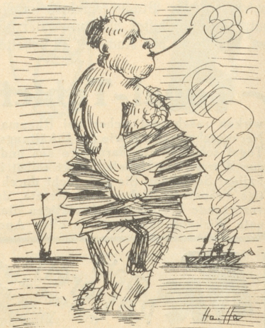
Warum denn nicht die Wadenbinden Sich um den Bauch beim Baden winden.