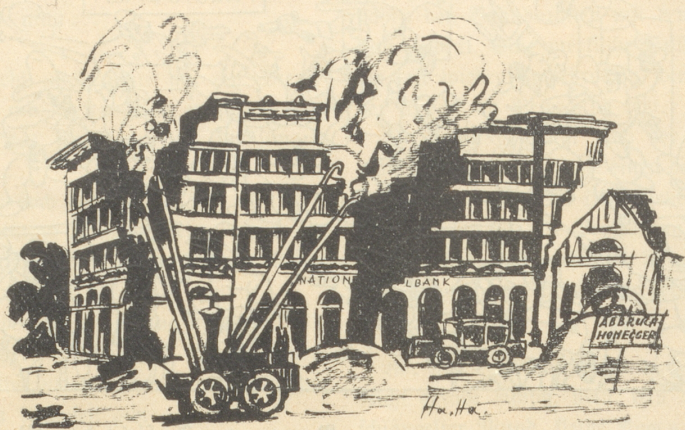
Wie es bald kommen wird.

Das eidgen. Finanzdepartement hat die Verkehrskommission auf Donnerstag den 16. August nach Bern einberufen. Die Kommission wird sich über die Gestaltung des Fünflibers, die eventuelle Prägung der Ein-, Zwei- und Fünffrankenstücke in Nickel, über die Ausgabe von Fünf- und Zehnfrankennoten und dergleichen auszusprechen haben. — Es ist scheint's vorgesehen, daß die Eidgenossenschaft für die neuen Nickelfünfliber auch das entsprechende Etui samt Tragvorrichtung liefern würde, was von der schweizerischen Trachtenbewegung allseitig begrüßt