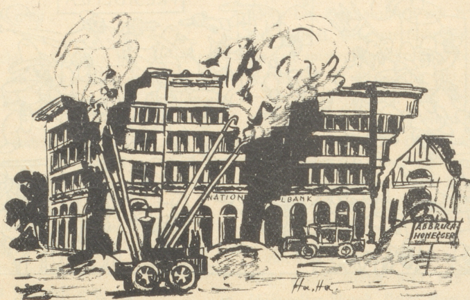
Wie es bald kommen wird.

Das eidgen. Finanzdepartement hat die Verkehrskommission auf Donnerstag den 16. August nach Bern einberufen. Die Kommission wird sich über die Gestaltung des Fünflibers, die eventuelle Prägung der Ein-, Zwei- und Fünffrankenstücke in Nickel, über die Ausgabe von Fünf- und Zehnfrankennoten und dergleichen auszusprechen haben. — Es ist scheint's vorgesehen, daß die Eidgenossenschaft für die neuen Nickelfünfliber auch das entsprechende Etui samt Tragvorrichtung liefern würde, was von der schweizerischen Trachtenbewegung allseitig begrüßt