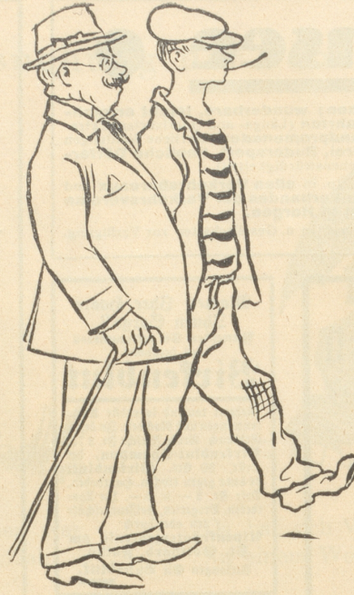
„Kleider machen Leute“ . . .