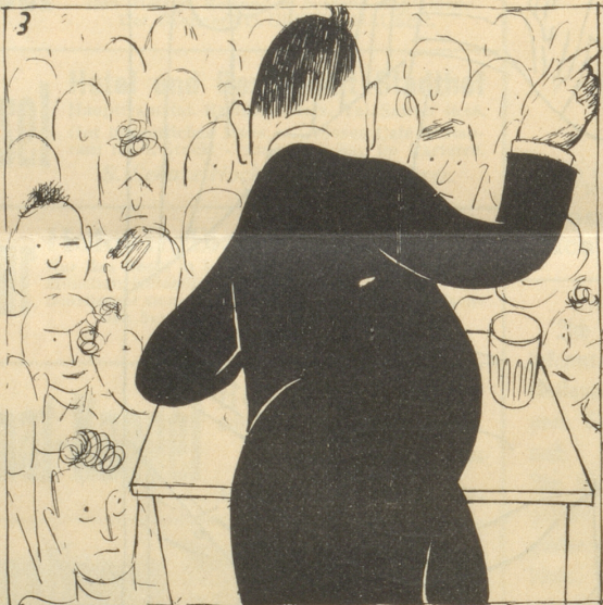
3 Meine jungen Freunde! Ohne eine ideale politische Weltanschauung gehen wir zugrunde. Sehen Sie sich wenigstens eine Ratsfzigung an.