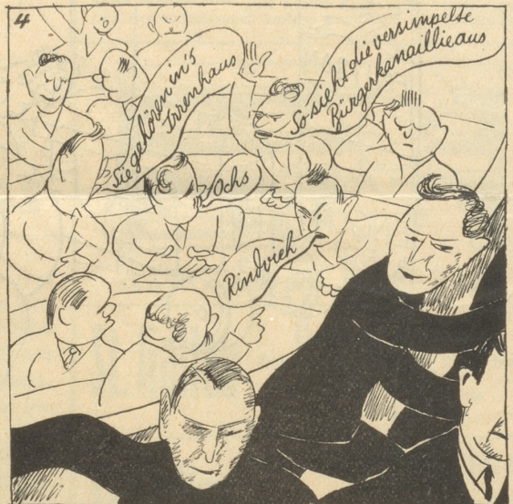
4 Die Jugend an der Ratsfzigung: Faul! Faul! Die Kerle kennen die primitivsten Regeln nicht!