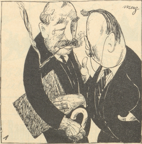
1 Politiker: Die Zahl unserer Parteimitglieder geht rapid zurück. Vor allem fehlt der Nachwuchs. Bemühen wir uns um die Jugend.