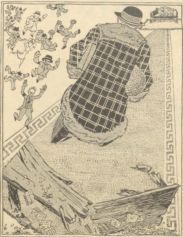
„Ei Bank um die ander goht mer hie, jetzt probier ich's wieder mit em Kanapee.“

Eine Viertelstunde später stieg das Christkind, warm eingepackt und reichlich mit mütterlichen Ermahnungen versehen, in das wartende Flugzeug, der Erzengel Gabriel