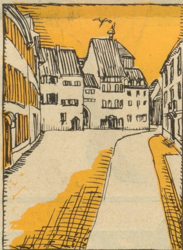
4. Auf dem Münsterplatz.

Prof. Babbepipji: Sie guete Frind, mir z'Basel bruche kai Kopsbahnhof, mir händ „Kopf“!