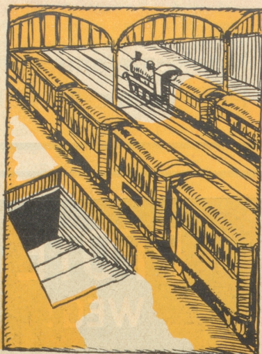
1. Am Bundesbahnhof.

Prof. Babbepipji: I bi glich gschpannt, wie da nei Kolleg Schnurrebärger usseh wird, da esseße Zirignot, wo'n i vo der Univeršidet bigriße sott.