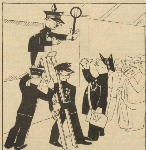
„Sez hät'r glueget, wo Sie dr Arm abe gha händ.“ „Sternehagel! Wänn i dä Chrampf ha!“