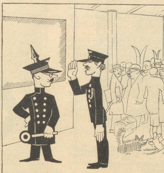
„De Zugführer hät gseit, er tüeg dänn en Pfiff, wänn's getti.“ „Guet, so göhnd äfängs gag dr Maschine vüre ga d'Lüt ärbegsteufe, daß 's mi gsehnd.“