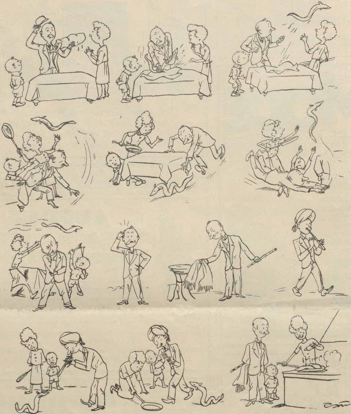
Was dem Aal passierte oder: Der Aal der kapitulierte.