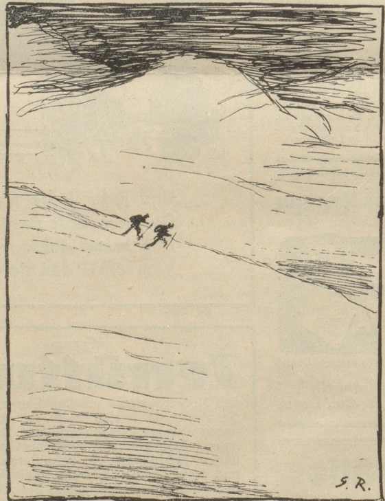
und wie er in Wirklichkeit aussieht.

Die L. N. N. schreiben unter Offiziersbeförderungen: