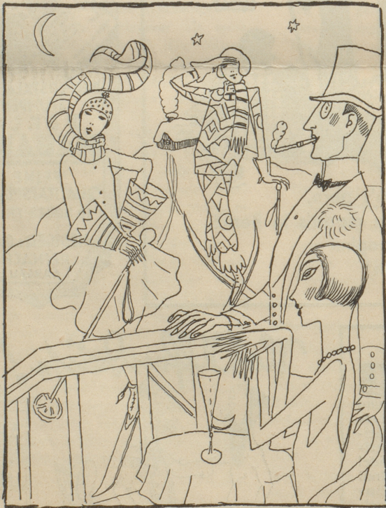
eine Sport- und Modezeitschrift sieht