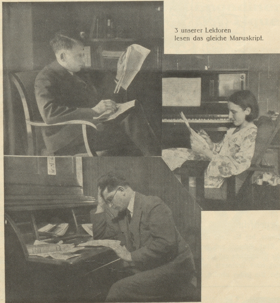
3 unserer Lektoren lesen das gleiche Manuskript.

Jedes Manuskript, das auf unserer Redaktion einläuft, wird nacheinander an mehrere Lektoren aus möglichst verschiedenen Interessensphären weitergeleitet. Sie haben die Aufgabe, den Beitrag daraufhin zu prüfen, ob er sie fesselt. Jeder Lektor streicht am Rande diejenigen Stellen an, die er gern gelesen hat.