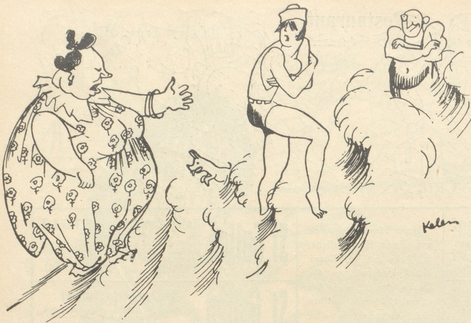
„Natürlich ist dir das Wasser zu kalt in dieser modernen Badehofe!“

vom jetzt so kräftig befruchtend fließenden strome pädagogischen lebens und schaffens unberührt;