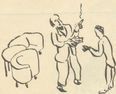
Baron Pacquement kauft Salonmöbel, deponiert und verkauft sie zum Schaden der Konkursmasse.