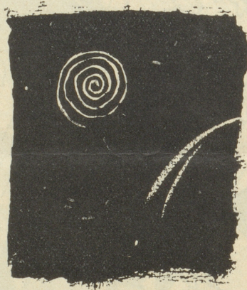
Geduld und Spucke

und betrachten Sie endlich diese dritte Aeusserung des zähen Kämpfers, die Sie zweifellos zu plötzlichem Verstehen führt. B6