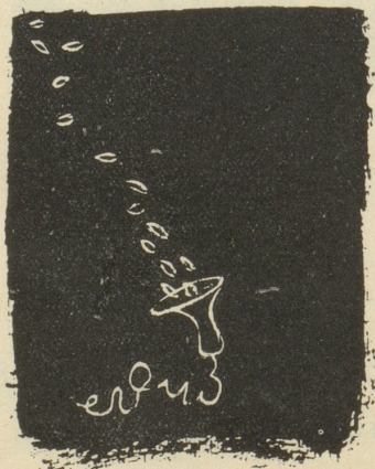
Ein Witz macht Kasse!

und betrachten Sie endlich diese dritte Aeusserung des zähen Kämpfers, die Sie zweifellos zu plötzlichem Verstehen führt. B6