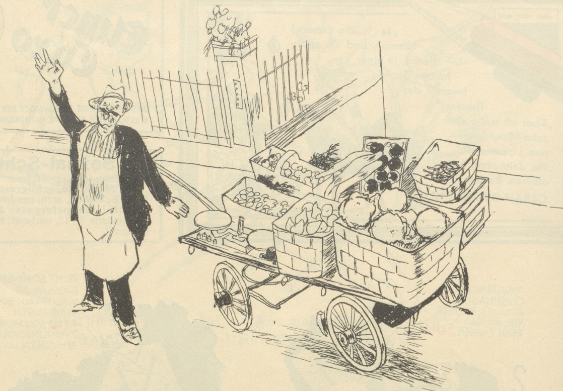
Apfel, Birne, Blumenkohl, schlanke Linie, Tomate, Wege zur Kraft und Schönheit.