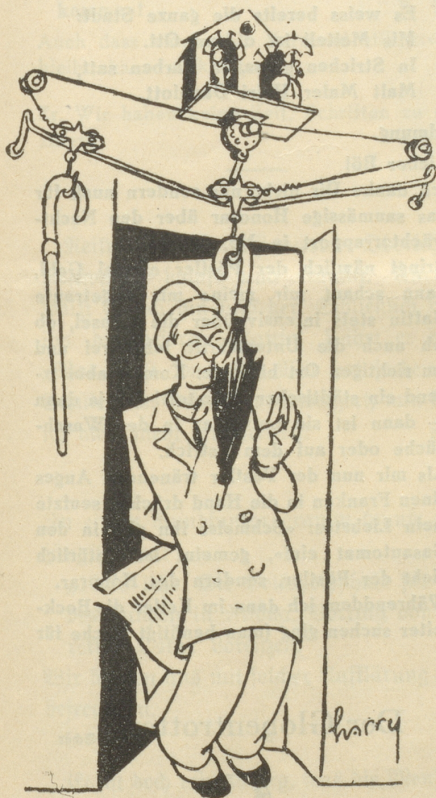
Der praktische Barometer