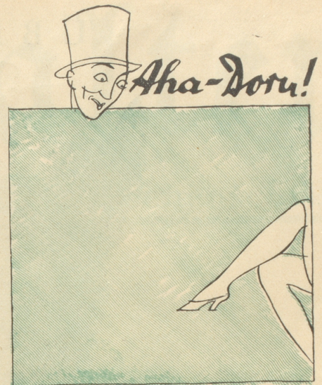
Verlangen Sie bei Ihrem Lieferanten den DORU-Strumpf

„Glauben Sie, ich habe noch mehr auszuhalten als Sie. Der Fritz hat vorhin unsere Billete zerrissen, das Mädchen hat ein Fenster im Coupé nebenan eingeschlagen, ich habe mein Portemonnaie zu Hause liegen gelassen und außerdem sitzen wir im verkehrten Zug.“