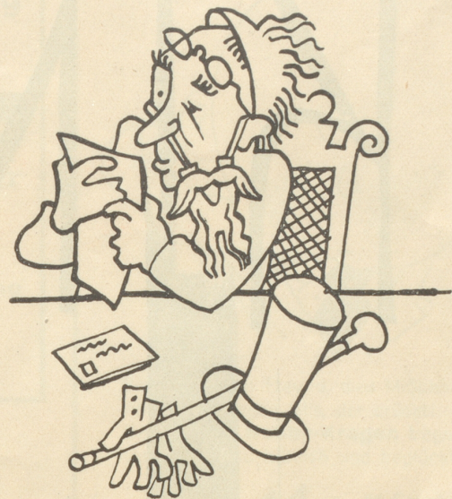
Kannst denken! Ein Blindgänger wirds. Das Theater reagiert glänzend ab, indem es sagt: Was verstehst Du überhaupt von unserem Theater? Wo Du nicht einmal weißt, wo der Schlüssel zur Garderobe hängt! Hi-hi!