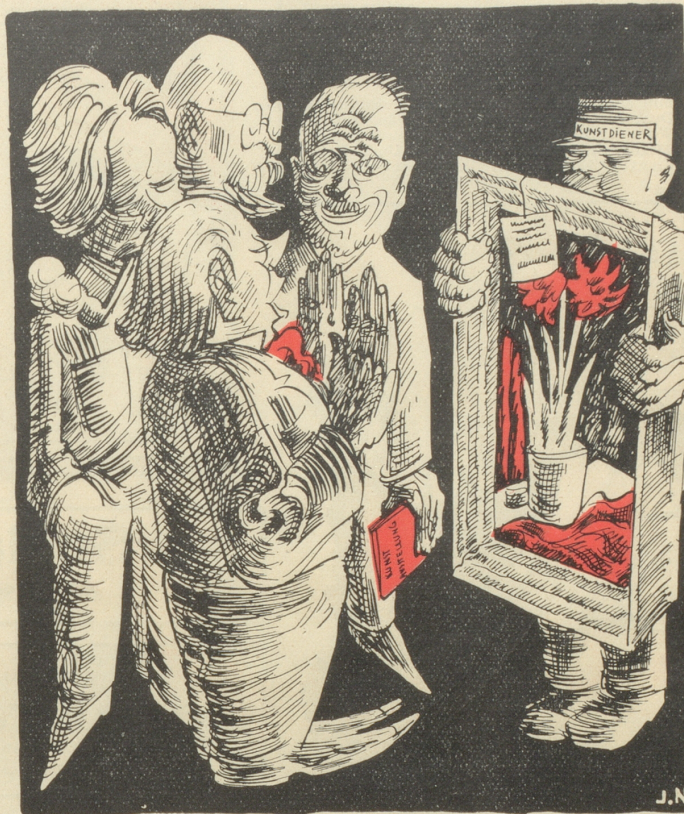
„'s Bild wär recht, aber de jung Maler soll warte mit usstelle, bis er en Name hät.“

BURGERS MILDE STUMPEN Nikotinschwach und doch aromatisch Gelbe Packung 80 Cts. — Weiße Packung Fr. 1.— Feine Derby Burger . . . . 10 Stück Fr. 2.—