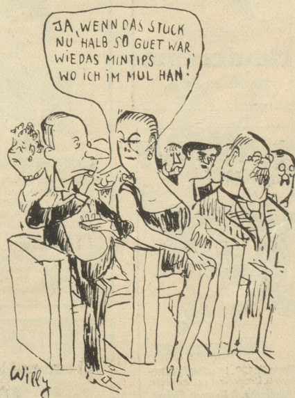
Die neuen, köstlichen Erfrischungs-Bonbons Mintips sind erhältlich in eleg. Etui zu 20 Cts. und offen nach Gewicht.