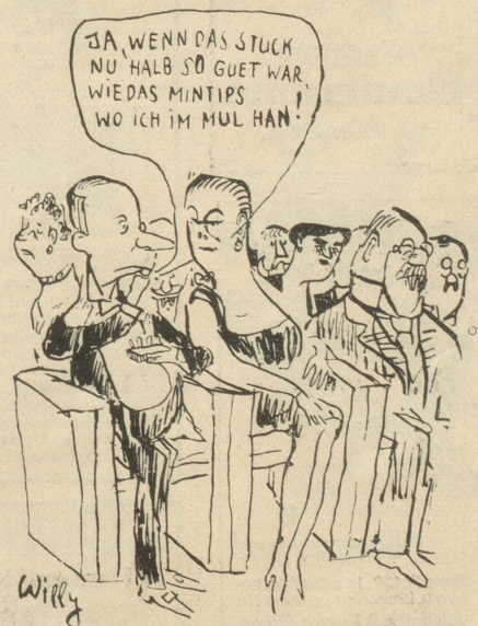
Die neuen, köstlichen Erfrischungs-Bonbons Mintips sind erhältlich in eleg. Etui zu 20 Cts. und offen nach Gewicht.