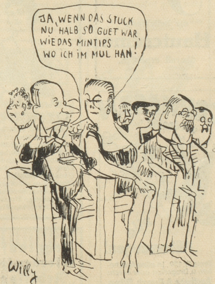
Die neuen, köstlichen Erfrischungs-Bonbons Mintips sind erhältlich in eleg. Etui zu 20 Cts. und offen nach Gewicht.