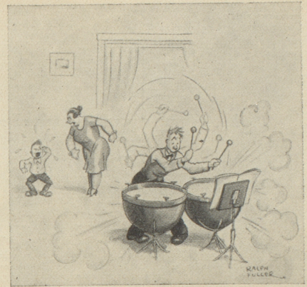
„Kurtchen! Willst du wohl ruhig sein, wenn Papa übt!“ Judge