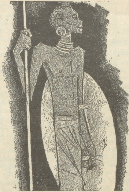
1. Der Zulu trägt keine SUN , weil er sie nicht braucht.