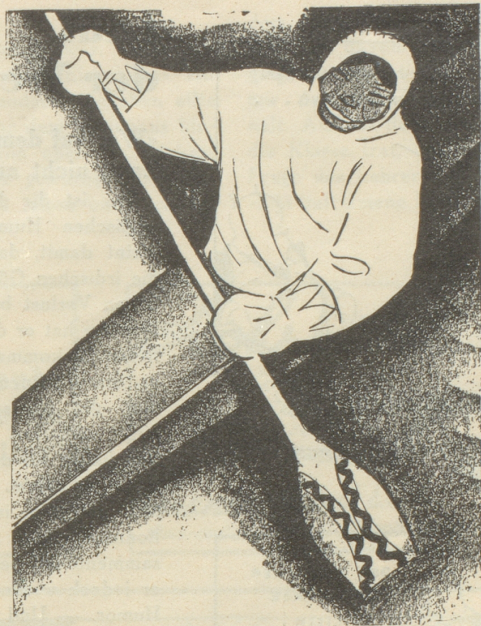
2. Der Eskimo trägt keine SUN , weil er sie nicht kennt.