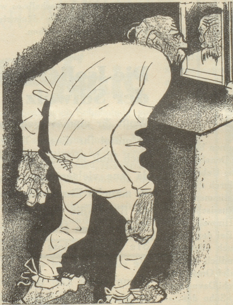
3. Der Hintermoser trägt keine SUN , weil ihm seine baumwollene Unterhose besser gefällt.