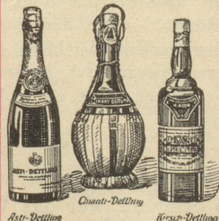
Asti-Dettling Chianti-Dettling Weiss-Dettling