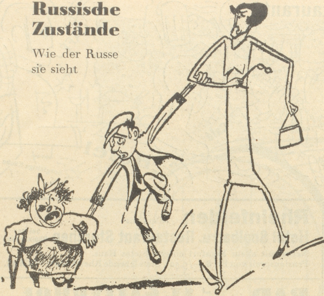
Links: Die Qualität