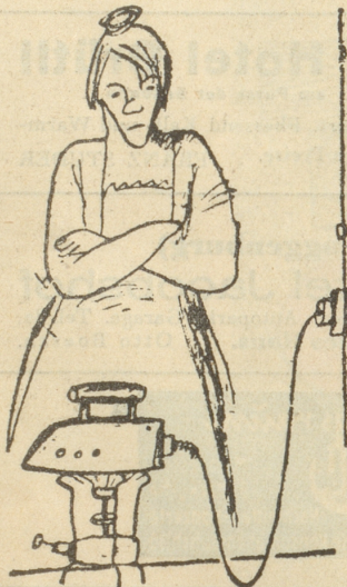
Gebrauchsanweisung für elektrisches Bügeleisen Vetchernaya Moskva

«Genug wissen? Mein letzter Chef ent- liess mich, weil ich ihm zuviel wusste!» (Tits-Bits)