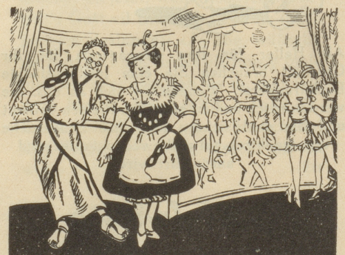
Nach der Demaskierung.

„Woran hast Du mich eigentlich unter dieser Grieden-Maske erkannt?“ „Nur an Deinen Hühneraugen! Warum hast Du die nicht längst mit „LEBEWOHL“* weggebracht?“