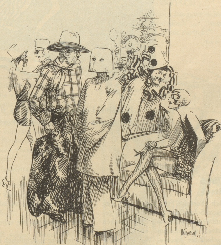
Der eifersüchtige Ehemann

„So — wer sagt Ihnen, dass ich schon zwölf gehabt habe?“