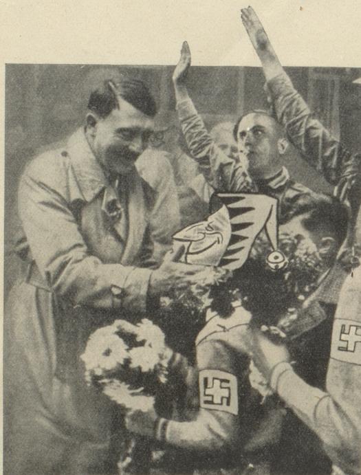
Ein Witz wird Wahrheit Der Nebelspalter begrüsst seinen neuen Führer

Am 8. September 1933 brachten wir dieses Bild als Witz. Wir ahnten damals nicht, wie bald es Wahrheit werden würde.