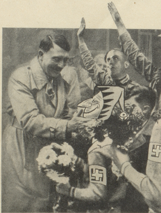
Ein Witz wird Wahrheit Der Nebelspalter begrüsst seinen neuen Führer

Am 8. September 1933 brachten wir dieses Bild als Witz. Wir ahnten damals nicht, wie bald es Wahrheit werden würde.