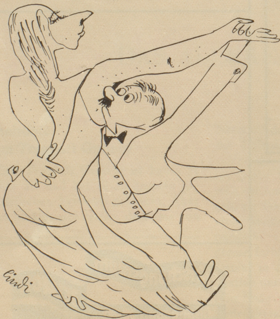
Der Mann und die andere Frau: