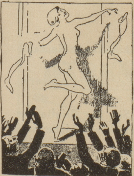
Marianne rüstet ab!