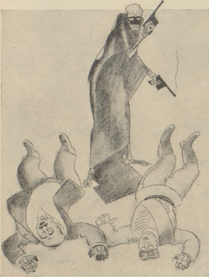
Der Diktator Europas