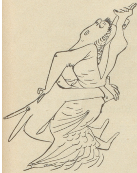
Mein ist dein ganzes Herz