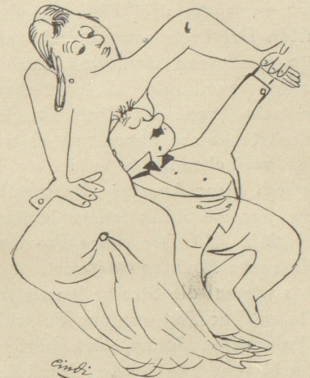
Jetzt isch mr's Bei igschlafe!

braune Pumps mit Wildledergarnitur. Drei Mark sechzig! — Und nur wegen meinem kleinen Fuss.