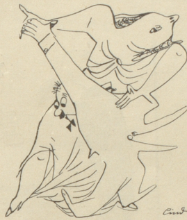
Wenn die Elisabeth . . .