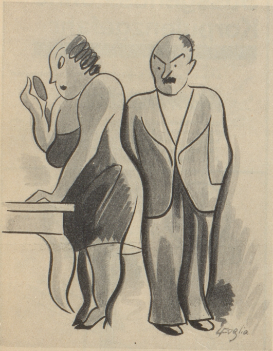
Nach der Meinung eines berühmten englischen Arztes werden die Frauen immer schöner.