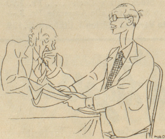
„ . . . das wird das größte internationale Schachturnier der Welt!“