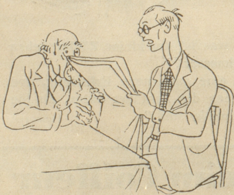
„Japan gegen Amerika . . .“