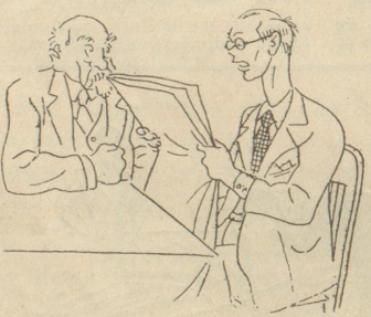
„England gegen Japan . . .“