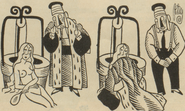
Die nackte Wahrheit — und der mildtätige Richter.