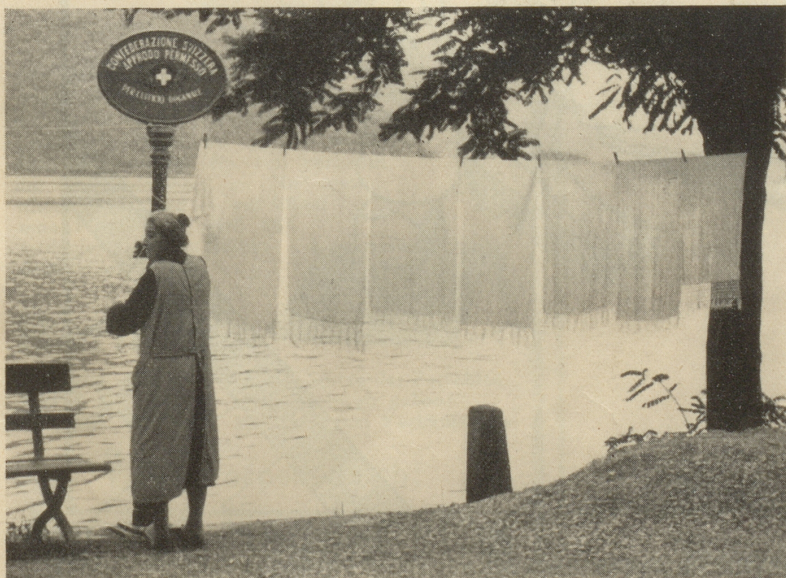
Ischt das öppe Bundeswösch?