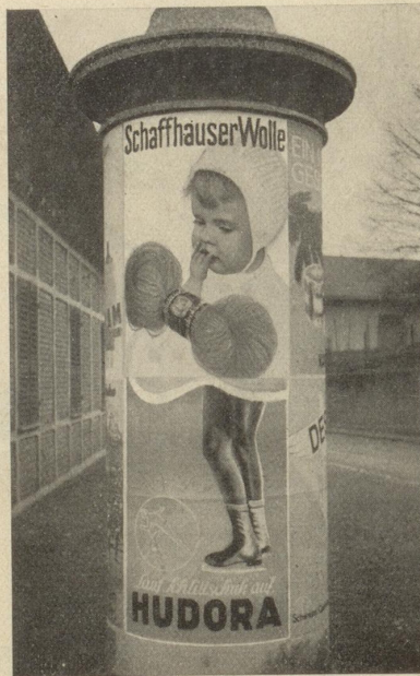
Gegen diese Schöpfung eines St.Galler Plakatklebers kann selbst Sonja Henje nicht mehr aufkommen.