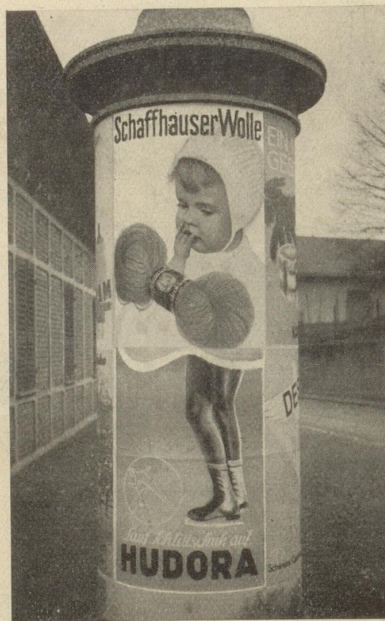
Gegen diese Schöpfung eines St.Galler Plakatklebers kann selbst Sonja Henje nicht mehr aufkommen.