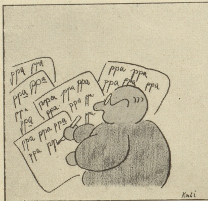
Bürzeli ist zum Prokuristen ernannt worden.