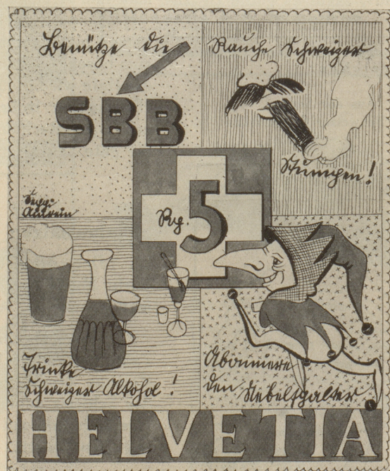
Aus der Serie: Neue Schweizer Briefmarken