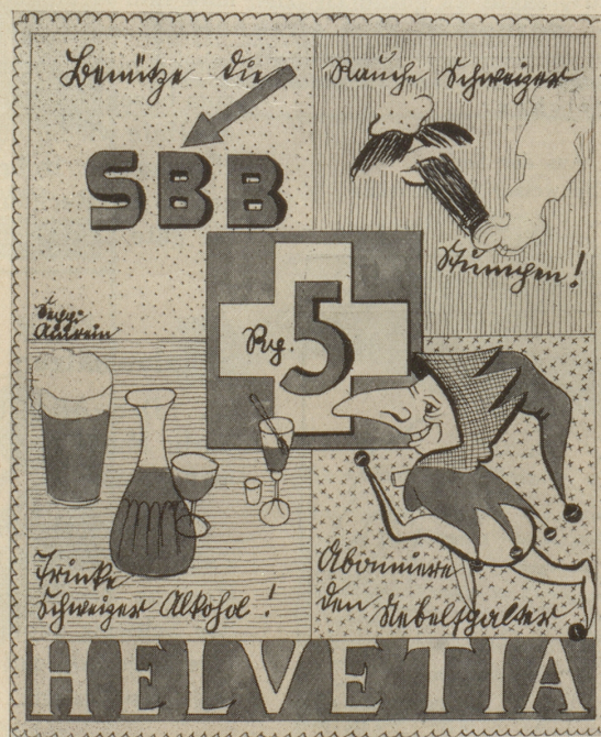
Aus der Serie: Neue Schweizer Briefmarken