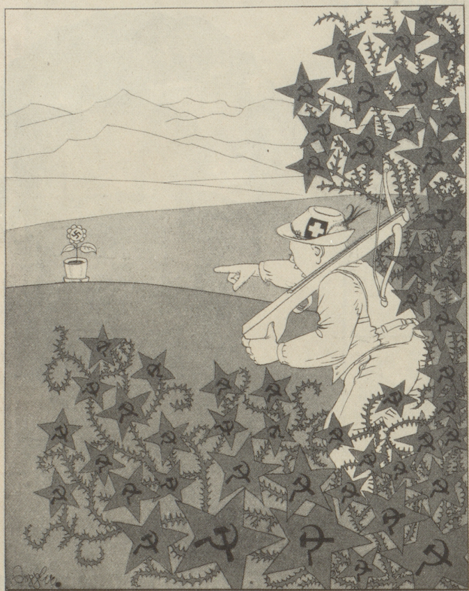
Der Eidgenosse: „Kous mit dieser Pflanze! Jä duide kein „inFrau“ in meinem Garten!“