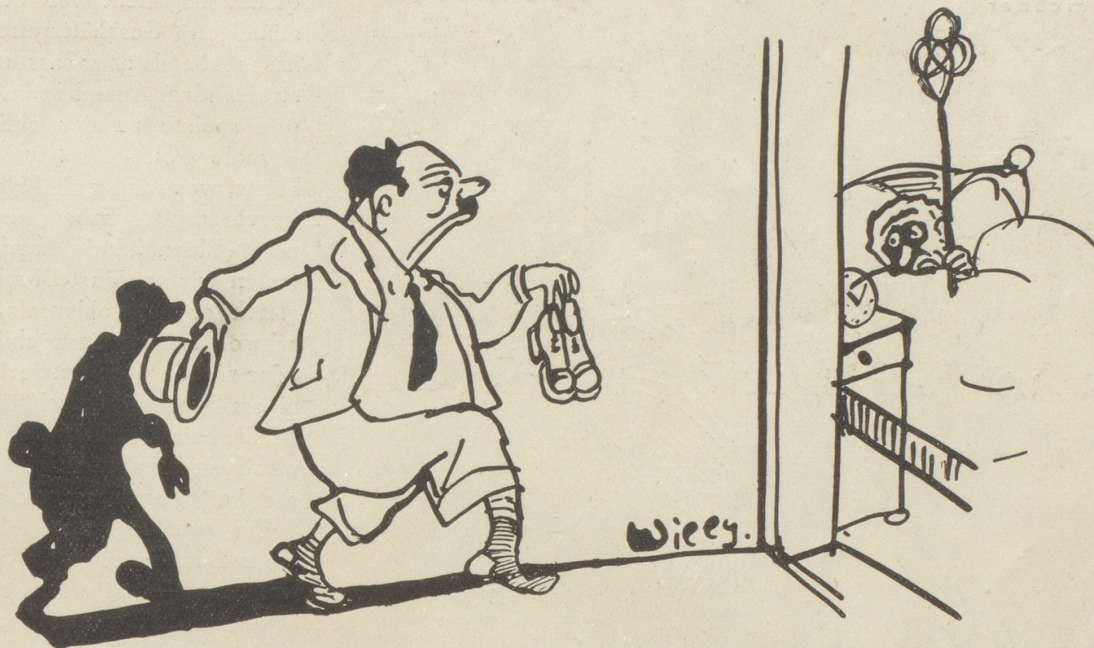
Der Diktator kehrt von der Diktatorenversammlung nach Hause zurück