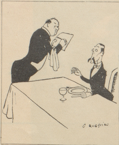
«Roten?» «Euh! lieber bloss Rosé!»